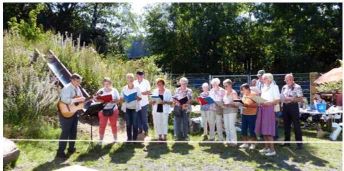
Bild: Liedvortrag der Singgruppe zum Jubiläum „150 Jahre DAV“ im August 2019