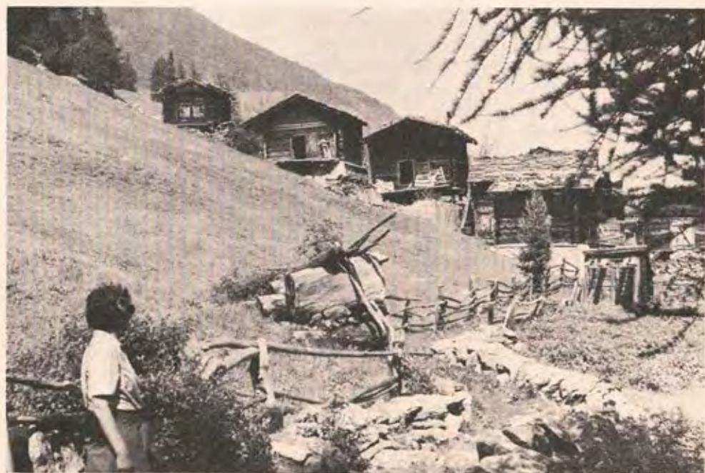
Spätsommer im Wallis